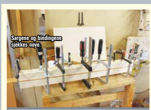
Sargene og bindingene sjekkes nøye.

4 INN-FRESING Neste skritt består i å freser inn binding og kantlister rundt det hele. Igjen, hvis vi bygger ti gitarer i en «batch», tar denne delen av prosessen rundt regnet to uker.