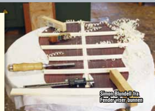
Simon Blundell fra Fender viser bunnen

1 MATERIALENE Brorparten av materialene får vi fra statene. Valget har selvsagt mye å si for lyden. Hvis vi bygger ti gitarer, trenger de ikke å låte likt – derfor varierer vi en del.